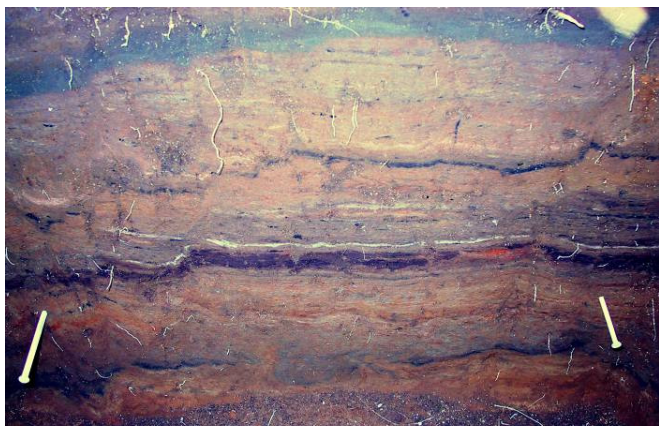
Snið í holu 2.