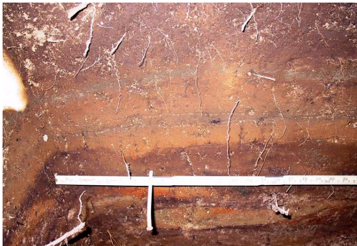
Snið í holu 1. Neðan tommustokks má sjá torf.