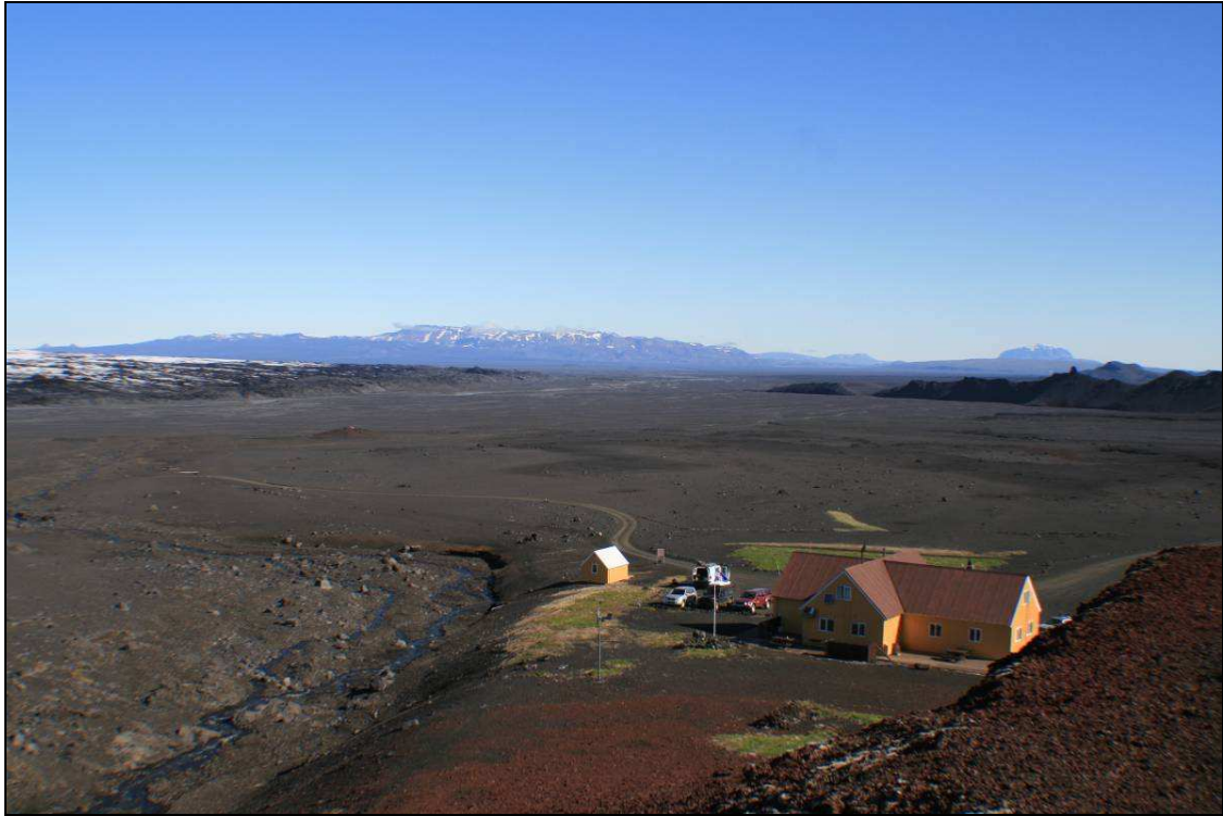
Mynd 2. Sigurðarskáli. Horft í NNW. Sólborg Una Pálsdóttir, 2008.

Kverkfjöll er megineldstöð í norðurbrún Vatnajökuls. Sitt hvoru megin við Kverkfjöll skríða fram Brúarjökull og Dyngjujökull. Stórt skarð, Kverkin, er í Kverkfjöllum og skríður Kverkjökull þar niður. Örfáa kílómetra frá sporði Kverkjökuls stendur Sigurðarkáli sem reistur var af Ferðafélögum Fljótsdalshéraðs, Vopnafjarðar og Húsavíkur árið 1971. 1 Bíslóð liggur frá skálanum inn á jökulurðina.