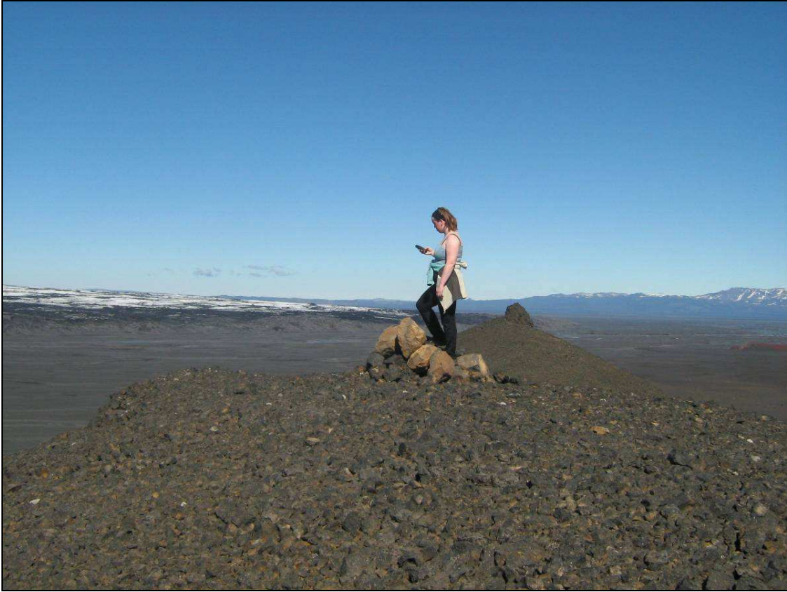
Mynd 4. Vörðubrot ofan á hálsinum norðan við Sigurðarskála. Horft í NV.

Englendingurinn William L. Watts fer árið 1875 þvert yfir Vatnajökull og lýsir Kverkföllum eins og þau líta út séð frá Vaðöldu, sem stóran gíg í norðanverðum Vatnajökli. 16 Níu árum seinna, árið 1884, er Þorvaldur Thoroddsen að kanna Ódáðahraun. Hann gerir tilraun til að ganga á Kverkfjöll en verður að hætta við vegna veðurs. Fyrstur manna til að kanna Kverkfjöll og hverasvæðið þar var Johan Peter Koch. Hann var danskur höfuðsmaður, sem fór fyrir sjö manna hópi á Vatnajökul sumarið 1912, undirbúningsleiðangri fyrir Grænlandsferð. 17