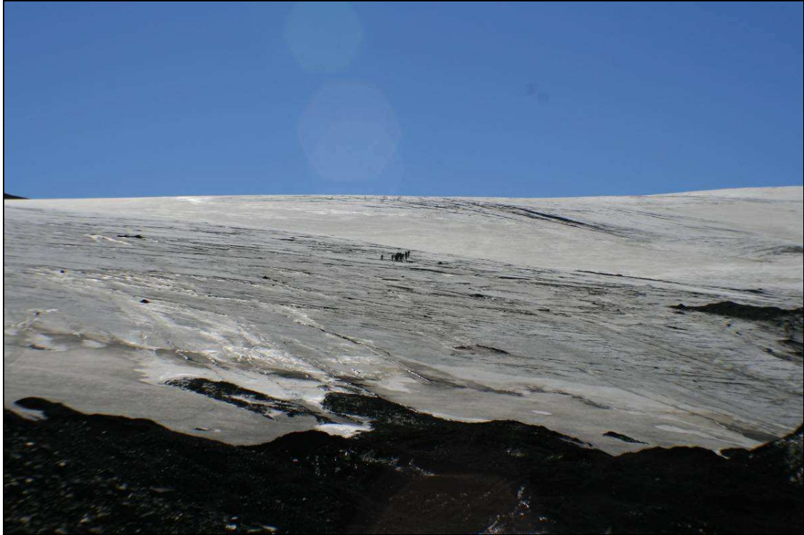
Mynd 3. Gengið upp á Kverkjökul. Horft í S. Ljósmynd Sólborg Una Pálsdóttir, 2008.

skriðu fram. Hvergi er að sjá minjar um þessar leiðir í grennd við rannsóknarsvæðið. Það er þó ekki loku fyrir það skotið að fram komi minjar, aðallega þá lausafundir, undan jöklinum sem sífellt er að minnka.