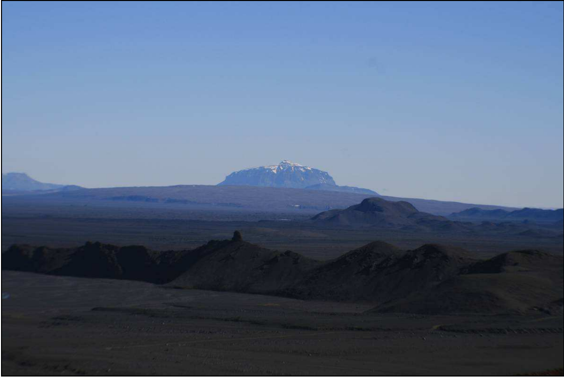
Mynd 5. Hálsinn eða hryggurinn norðan við Sigurðarskóla þar sem lausagripir eftir leiðangursmenn hafa fundist. Horft í N.