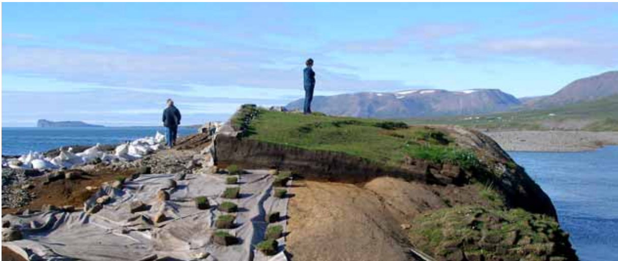
Kolkuós í Skagafirði