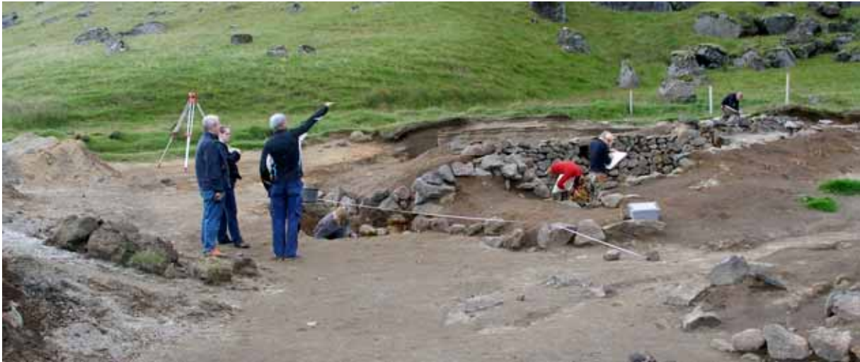
Uppgröftur við Bæ í Örcæfasveit