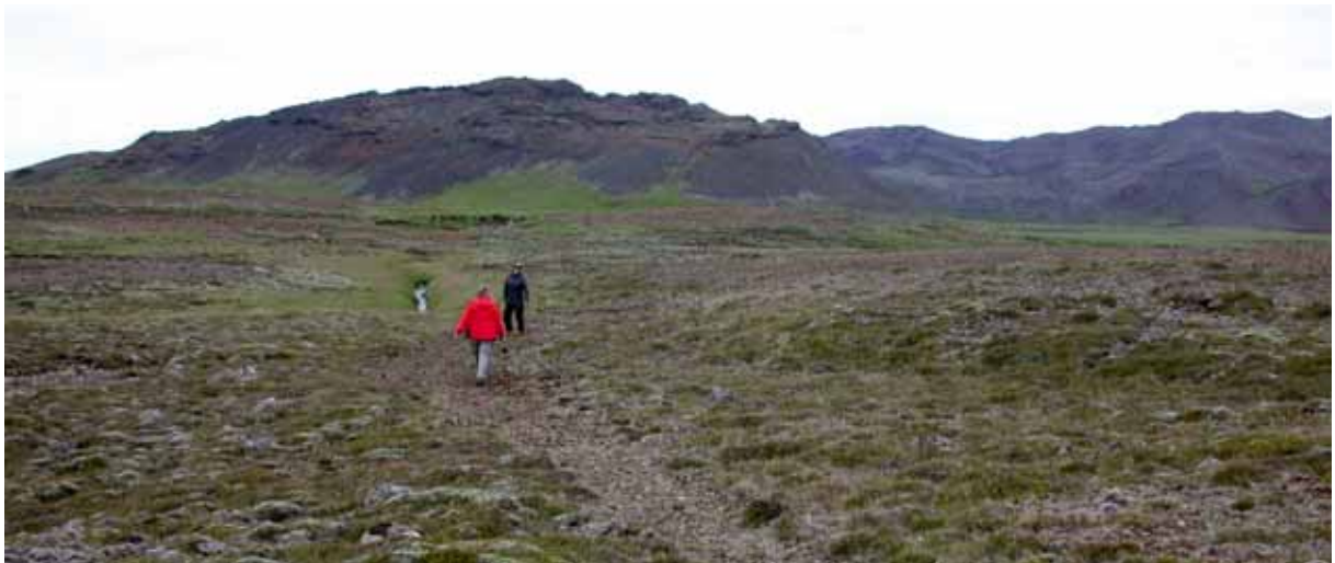
Gengið troðnar slóðir