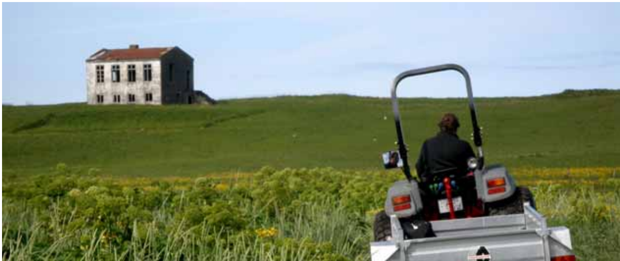
Flatey á Skjálfanda