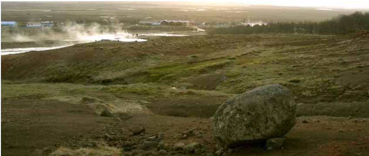
Konungssteinn við Geysi