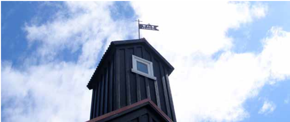
Kirkjuvogur í Höfnum