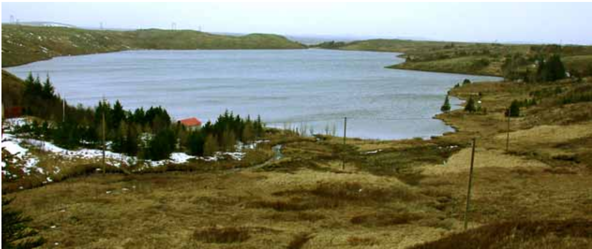
Traðarsel í landi Mosfellsbæjar