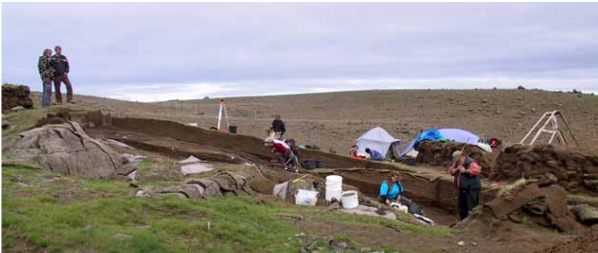
Uppgröftur við Hrísheima