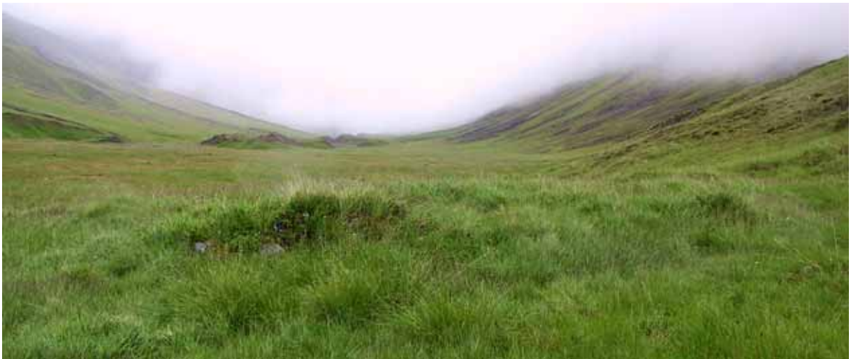
Sel í Hvassafellsdal