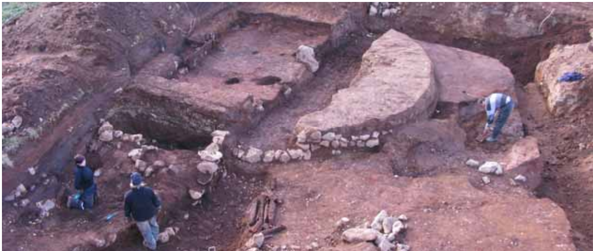
Vík í Skagafirði