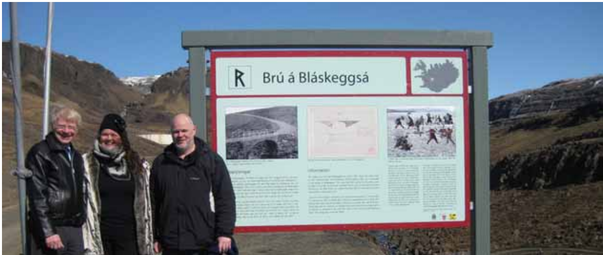
Nýtt skilti við brúna yfir Bláskeggsá