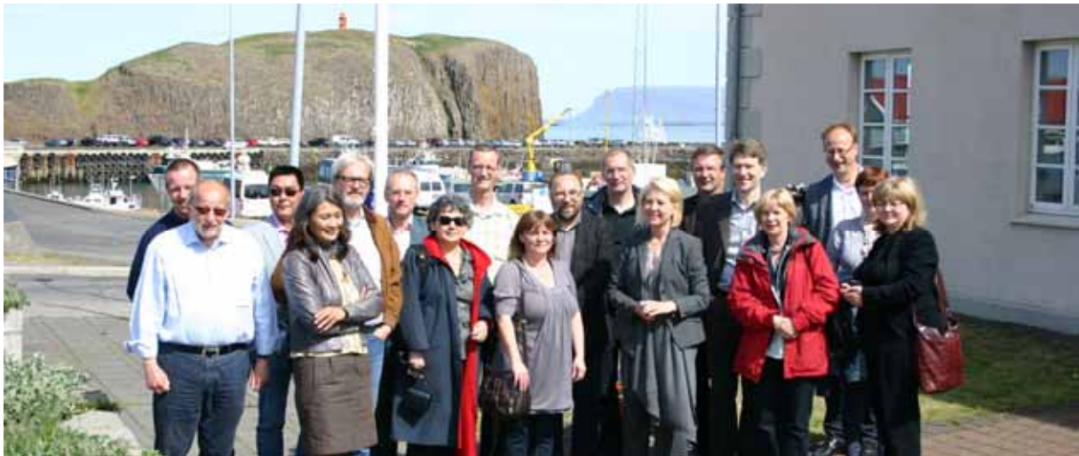
Þjóðminjavarðafundur í Stykkishólmi