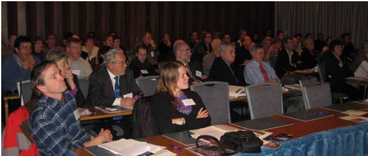
Alþjóðleg ráðstefna um fjarkannanir og minjavörslu