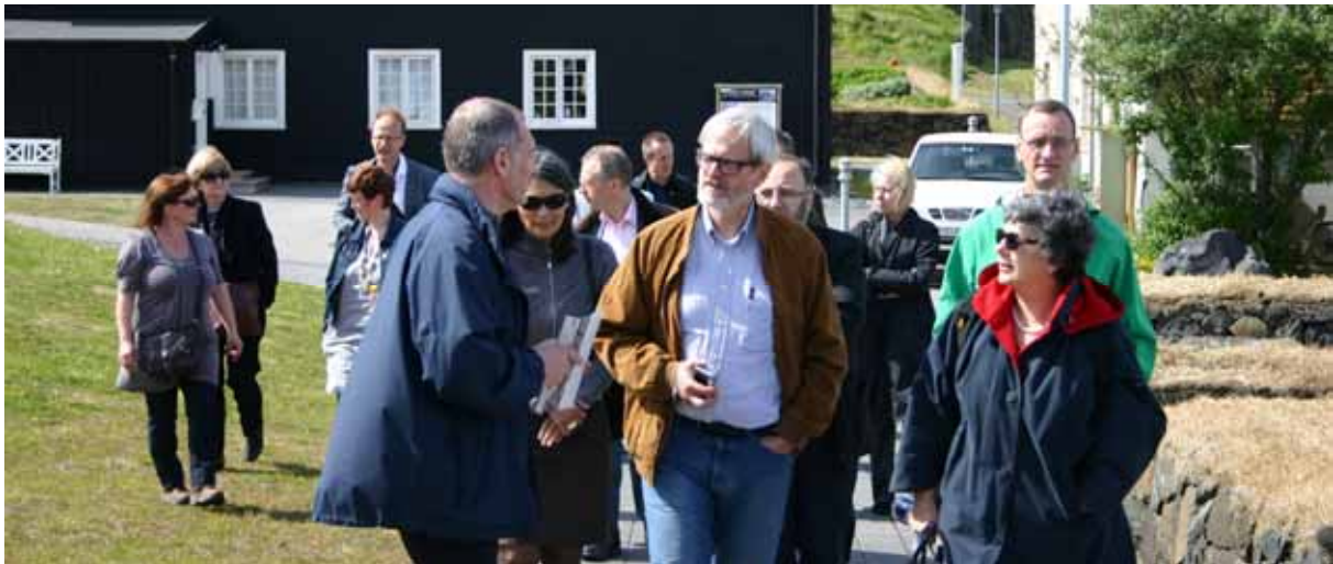
Minjavarsla Norðurlanda á Stykkishólmi