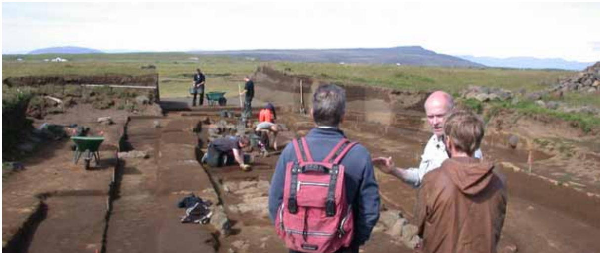
Uppgröftur við Þjótanda